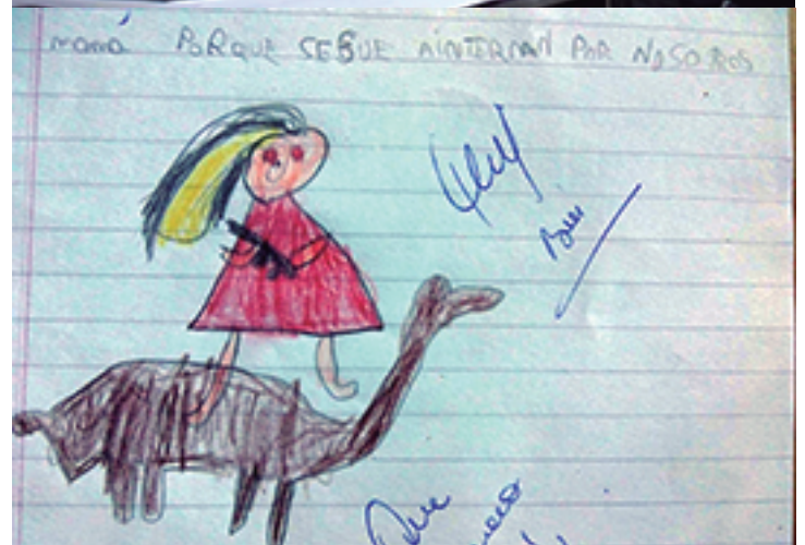
Su hijo la representó en un dibujo para la escuela