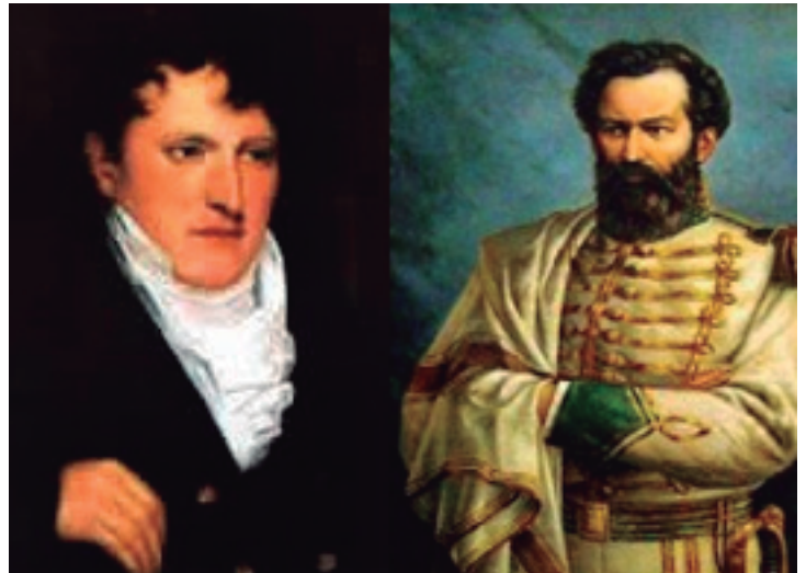
Los Generales Manuel Belgrano y Martín Miguel de Güemes

En sus últimos años de vida Manuel Belgrano combatió en la guerra civil contra los federales, pero a mediados de 1819 cayó enfermo. Falleció de hidropesía, en Buenos Aires, el 20 de junio de 1820. Ese día, y en su homenaje, se celebra en el país el Día de la Bandera Nacional.