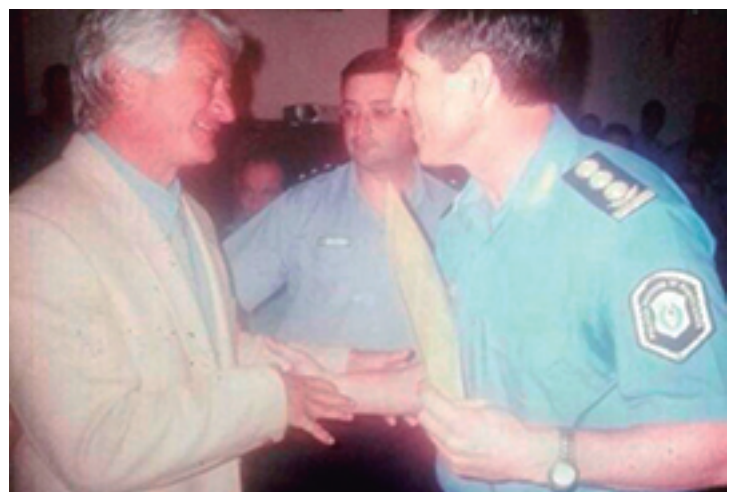
Recibiendo una distinción en el año 2002