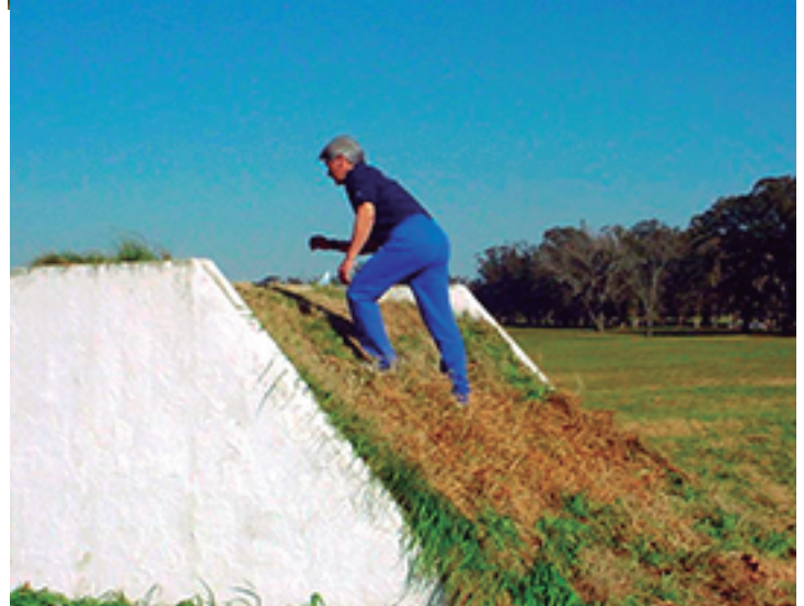
Profesor Pocai en la pista