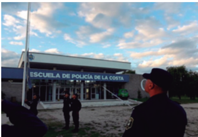
Plaza de Armas y fachada de la escuela