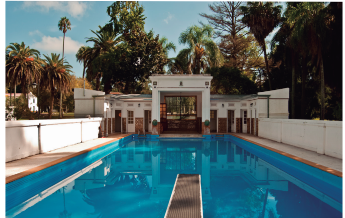
Interior de la piscina construida en 1916

En la escuela, la pileta funcionó a partir de la década del 80, cuando se comenzó a usar para la práctica deportiva de los cadetes con una preparación que tenía como fin el Operativo Sol. Luego vino un periodo de techado que tras unos años fue desmantelado para conservar el estilo original.