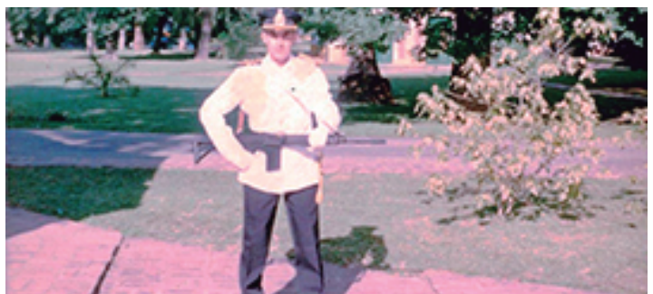
Cadete de la Escuela