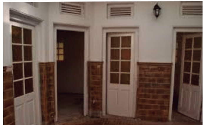
Vestuarios y duchas