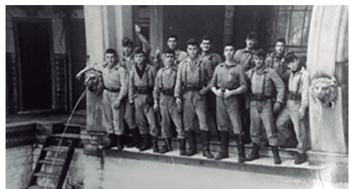
Cadetes reparando la piscina en 1960